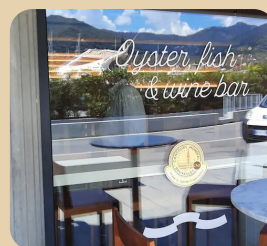
Bistrot Pedol Oyster and Fish Bar ITALIA