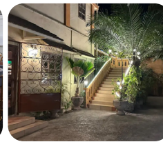
Les Trois Mousquetaires BENIN