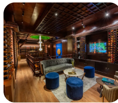
Mexico City Wine Bar MEXICO