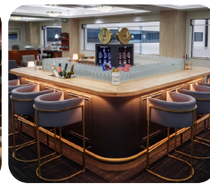
Mexico City Airport Wine Corner MEXICO