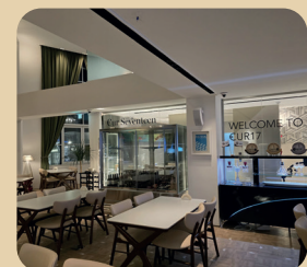
Eur 17 COREA DEL SUR