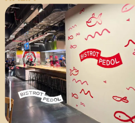
Bistrot Pedol al Mercato Centrale Bolzano Bozen - WaltherPark ITALIA